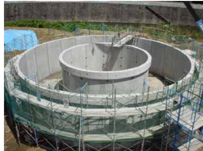
日本下水道事業団