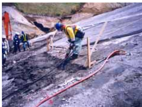
ピックハンマ人力掘削 従来工法