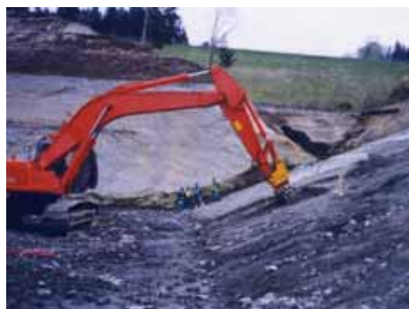
ツインヘッド機械掘削 縮減工法