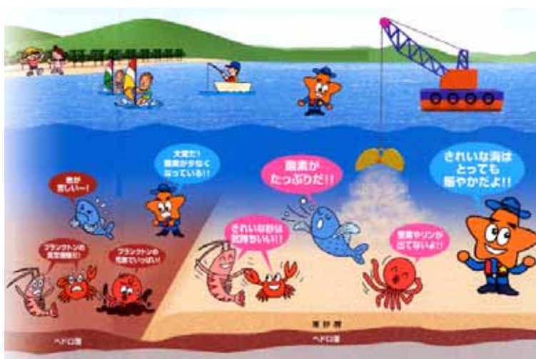
（土砂資源活用イメージ）