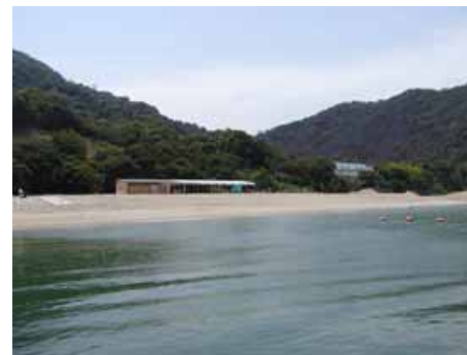
（屋釜海岸養浜後(竣工時)：上 屋釜海岸養浜施工状況：右)