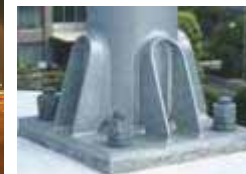
従来型照明柱と水銀灯