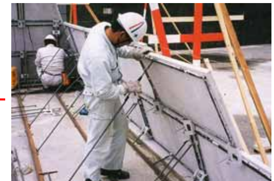
残存型枠施工状況写真