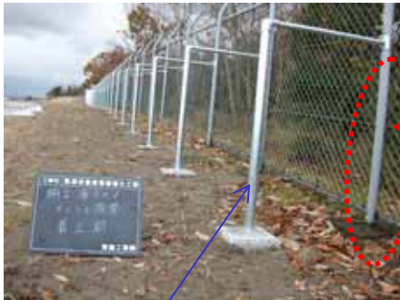
(あらかじめ控え柱設置)

控え柱を設置し、既存の支柱及び基礎を再利用することによりコスト削減が実現される。( 縮減額 14百万円、縮減率 約10% )