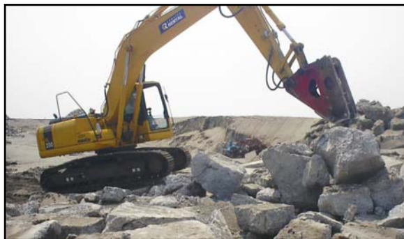
発生材の加工状況