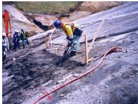
ピックハンマ人力掘削 従来工法