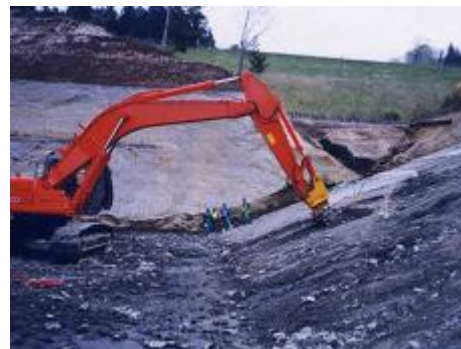
ツインヘッド機械掘削 縮減工法