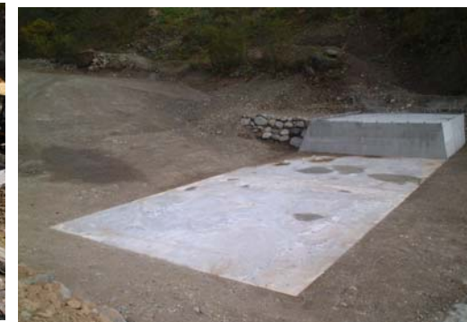
(新粗石コンクリート工法)