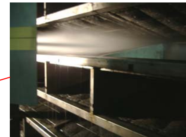
ウォータージェット式 フィルター洗浄装置