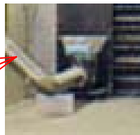
空気圧による 除塵フィルター 洗浄装置