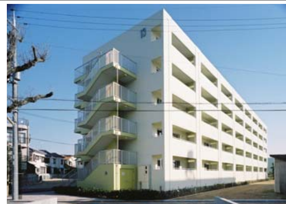
(エレベーター設置後)