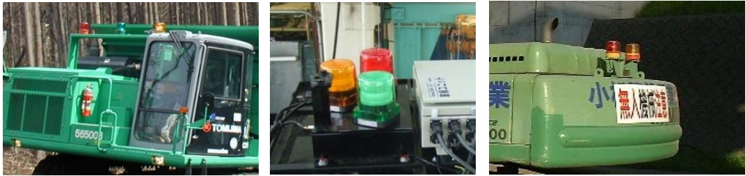
写真 5.1 自動建設機械の表示灯の例