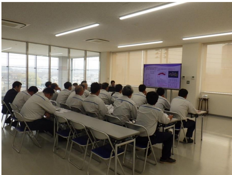
情報化施工基礎教育