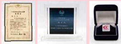
研修実施取組みとして全国初の受賞『令和元年度i-Construction大賞』授与式令和2年1月14日：国土交通省