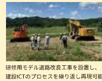
研修用モデル道路改良工事を設置し、建設ICTのプロセスを繰り返し再現可能。