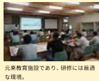
元来教育施設であり、研修には最適な環境。