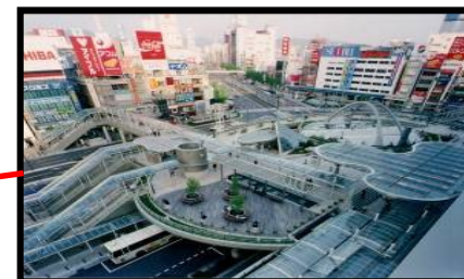
歩行者デッキ等の整備