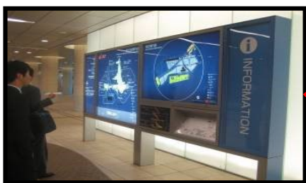
案内板の設置・管理