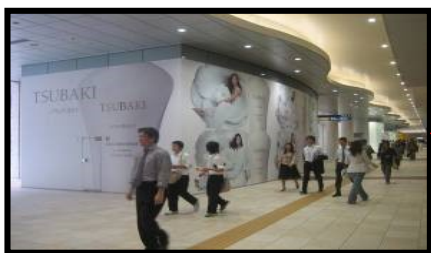
広告物の設置・管理