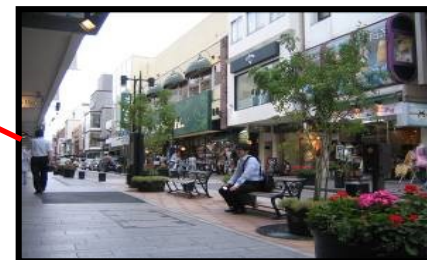
ベンチ・植栽の設置・管理