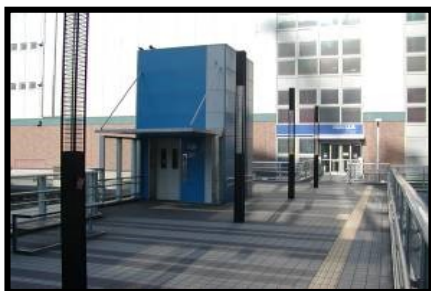
エレベーター等の設置・管理