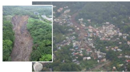
R3.7 静岡県熱海市 死者28名、住宅被害98棟