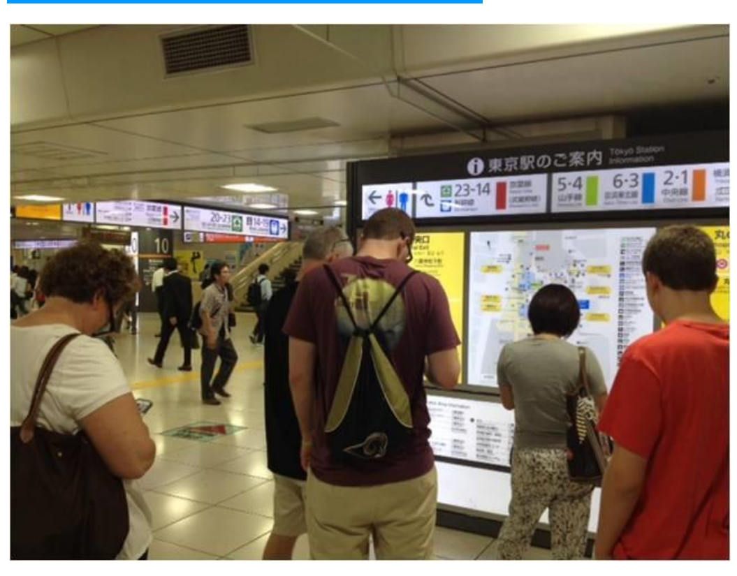
改札を出たが行き方が分からず、案内標識前でスマホ等を見ながら滞留