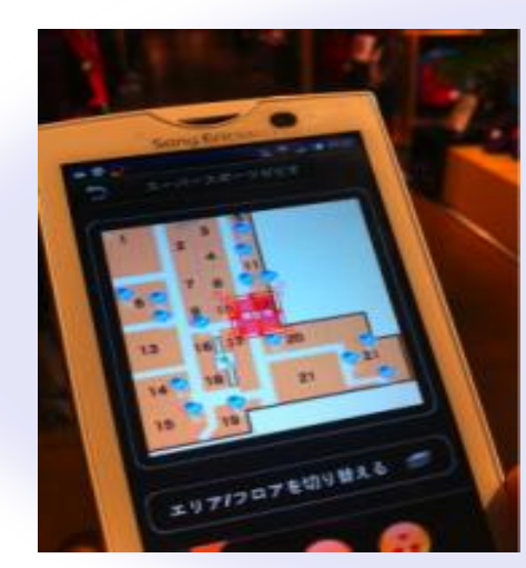
地下の駅改札から出て地上の目的バス停まで 地上・地下シームレス・ピンポイントにナビゲーション