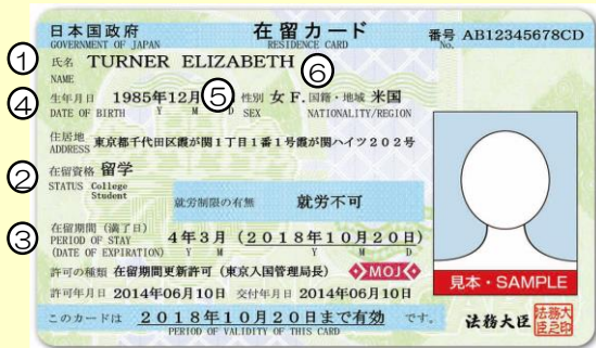
在留カード例（表面）