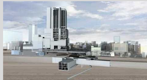
地下街を含む公共空間3次元化イメージ