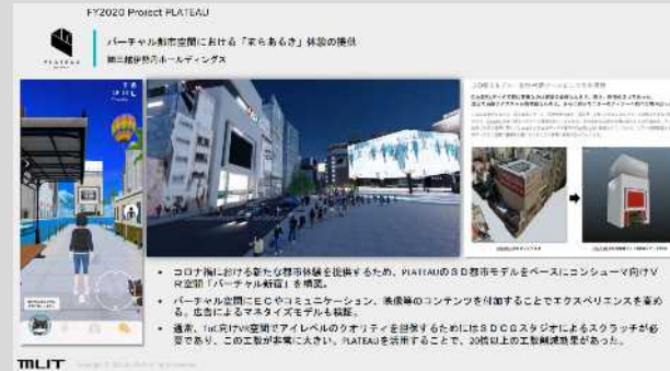
来街者・来館者への活用の事例（国土交通省HPより）