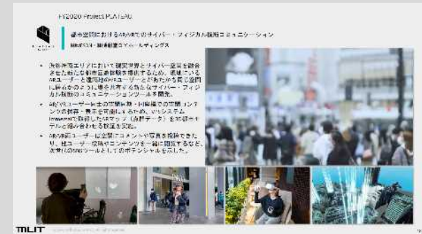
VR利用の例（国土交通省HPより）