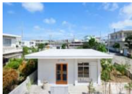
【島民と共につくる、おばあいの宿】

空き家をリノベーションした建物を宿泊施設として活用しながら、コミュニティの拠点とする取組