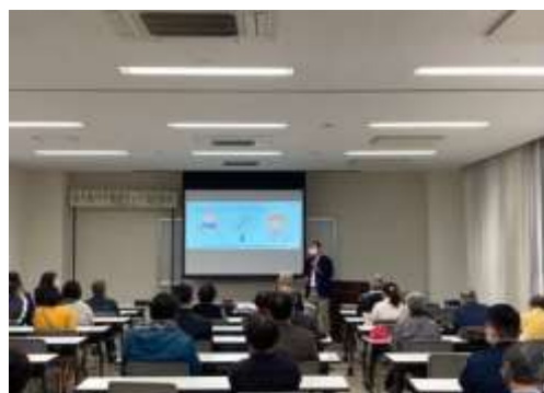
【相続対策セミナー】

暮らし人(ソフト面)の視点から、地域包括支援センター・信用金庫・行政と空き家や空き家になる前の段階での対策を模索