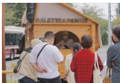
【日替わりで来訪するキッチンカー】

なりわい長屋というコンセプトのもと、バスターミナルを中心とした店舗併用賃貸長屋を核とする地域コミュニティとモビリティの拠点