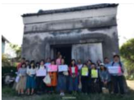
【The Bath & Bed Hayama(ザ バス アンド ベッド ハヤマ)】