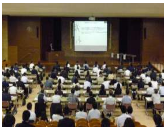
【住環境向上セミナー】

会員企業や家主に対して、空き家・空室対策ノウハウをはじめ制度改正等に係るセミナーを開催