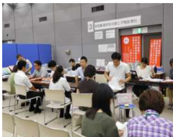
【大規模災害時の行政事務補助】

会員企業や家主に対して、空き家・空室対策ノウハウをはじめ制度改正等に係るセミナーを開催