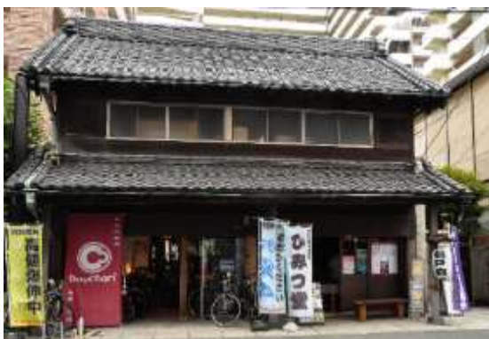
【古民家スタジオ 旧・原田米店】