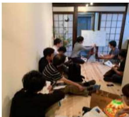
【空き家・古家物件見学ツアー】