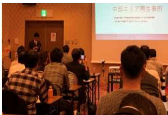
【古家再生投資プランナーのセミナー】