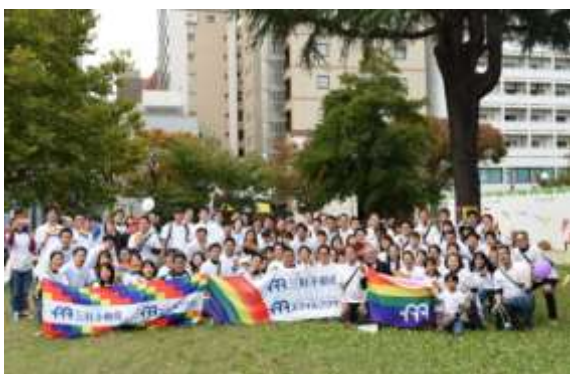
【九州レインボープライドへの参加】

LGBTQを始めとする全ての子どもたちが自分らしく生きていける社会の実現を目的としたパレードに2016年から社員で毎年参加