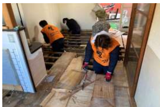
【浸水した家屋の保全活動】

LGBTQを始めとする全ての子どもたちが自分らしく生きていける社会の実現を目的としたパレードに2016年から社員で毎年参加