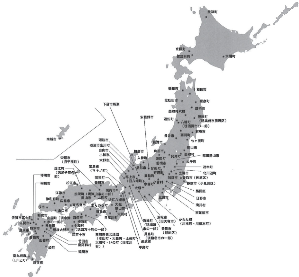
参考 3-2-7 「水の郷百選」分布図