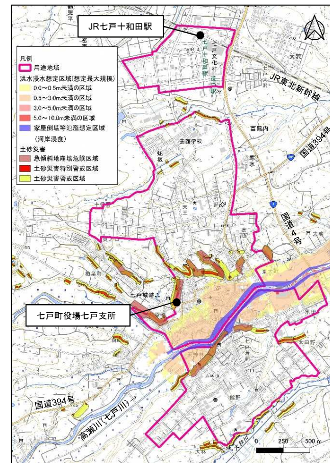
七戸町の用途地域とハザードエリア