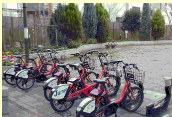
自転車駐輪施設の設置