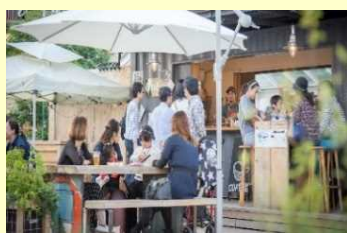
オープンスペースの活用