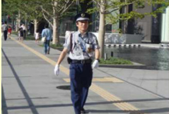
賑わいの創出に伴い必要となる巡回警備