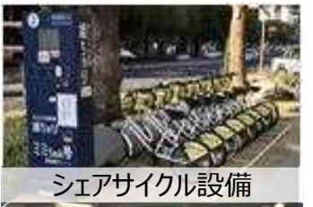
シェアサイクル設備