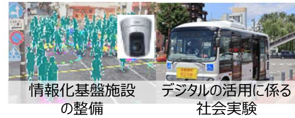
情報化基盤施設の整備