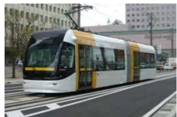
路面電車・バス等の公共交通の施設 (車両を除く)