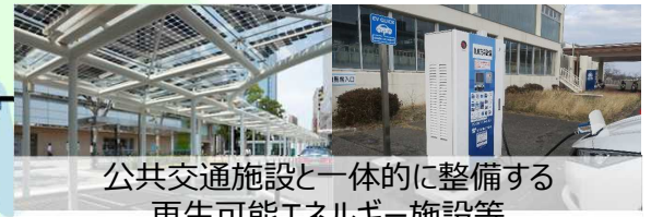
公共交通施設と一体的に整備する再生可能エネルギー施設等