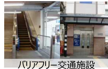
バリアフリー交通施設