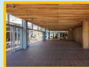
多目的利用スペース