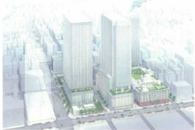
日本橋二丁目地区(東京都中央区) 容積率:800%、700% → 1990% 等

都市再生に貢献し土地の高度利用を図るため、都市再生緊急整備地域内において、既存の用途地域等に基づく規制にとらわれず自由度の高い計画を定めることにより、容積率制限の緩和等が可能。