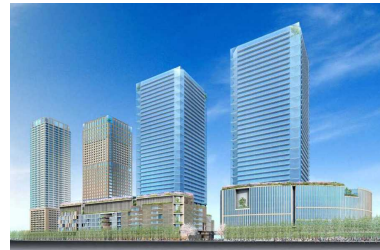
大阪駅北地区(大阪市) 容積率:800% → 1600% 等