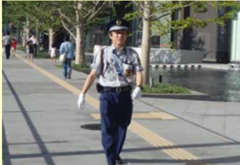
賑わいの創出に伴い必要となる巡回警備