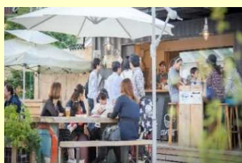
オープンスペースの活用