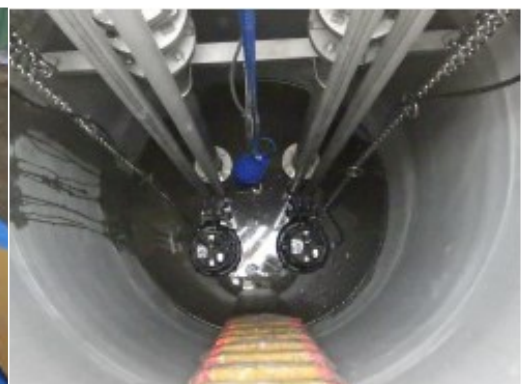
マンホールポンプ