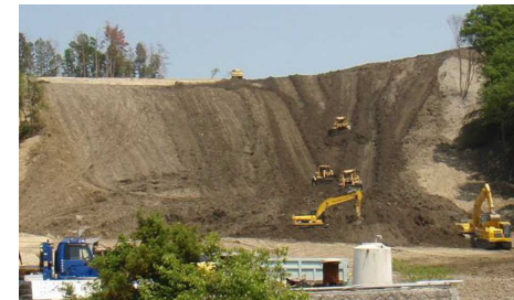
盛土撤去工事のイメージ