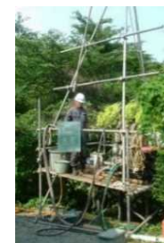
安全性把握調査 (ボーリング調査)

原則として、農業振興地域の整備に関する法律（昭和44年法律第58号）第6条により指定された地域又は森林法（昭和26年法律第249号）第5条第1項の地域森林計画の対象となる民有林として指定された区域以外の区域とする。ただし、その事業の性格上特定の地域に限定して実施することがかえってその十分な効果の発現を妨げることとなるものについては、この限りではない。