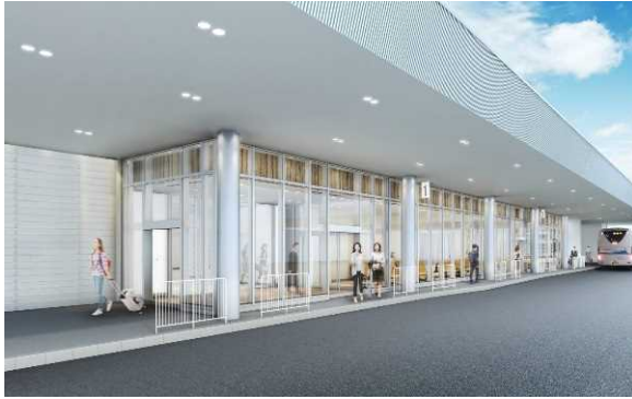
商業施設（バスターミナル部分）