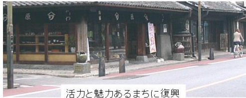
活力と魅力あるまちに復興