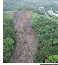
死者28名、住宅被害98棟