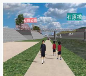
人流データの可視化 作成した3D都市モデルに人流計測値を元 にした瀬野川(河川)数の利用状況を動画とし てまとめ、イメージを共有することで今後の河 川数の活用検討に活かすことができる。