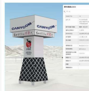
屋外広告物・景観施設の可視化 3D都市モデルに属性情報を付与し、 対象施設の適正な管理・把握に活用