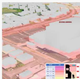
浸水深の3D表示 洪水浸水想定と建築物LOD1を 重畳表示したイメージ図