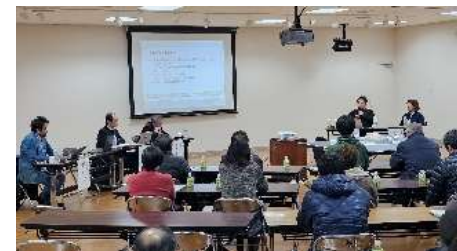
都市再生推進法人の育成支援