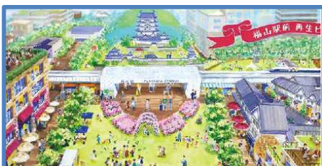
官民の多様な主体でビジョン共有