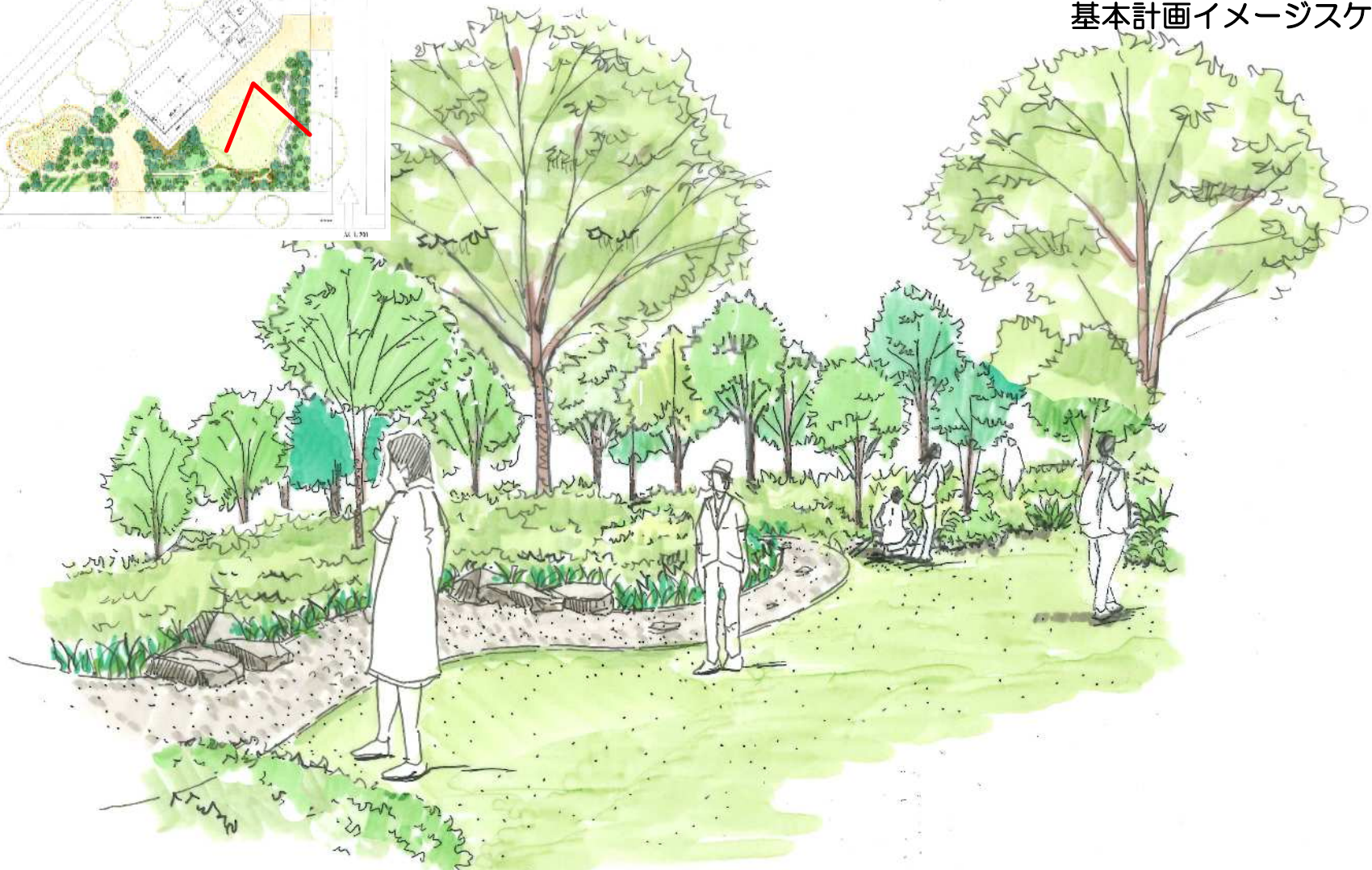
展示館出口から、農家の庭先となる行催事広場・枯流れの庭を望む

日本人の自然観を表す日本の伝統的造園技法である枯山水と川口市の多様な灌木・地被類が融合した空間