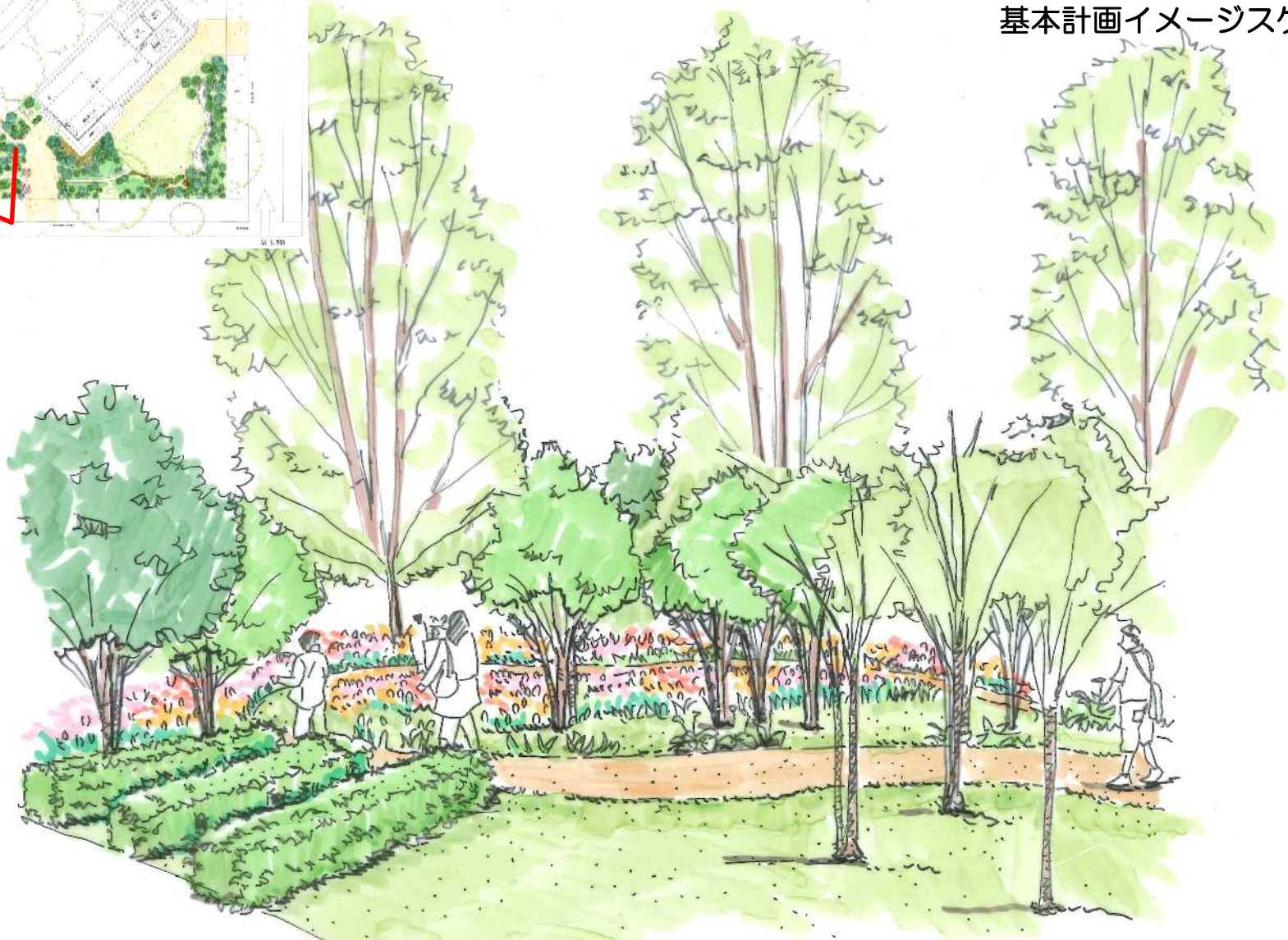
里帰りの林床花壇

横浜に根付いたチューリップ等による球根花壇を展開 2027横浜国際園芸博のPRの場として活用