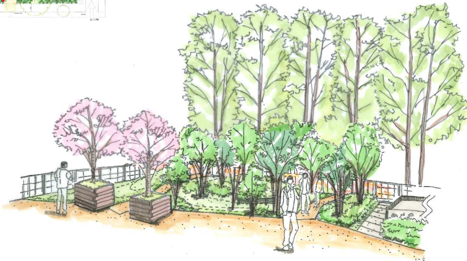
展示館から里の杜（生活の庭・築山）を望む 四季の花木等により日本の四季の風情を日本庭園的に表現