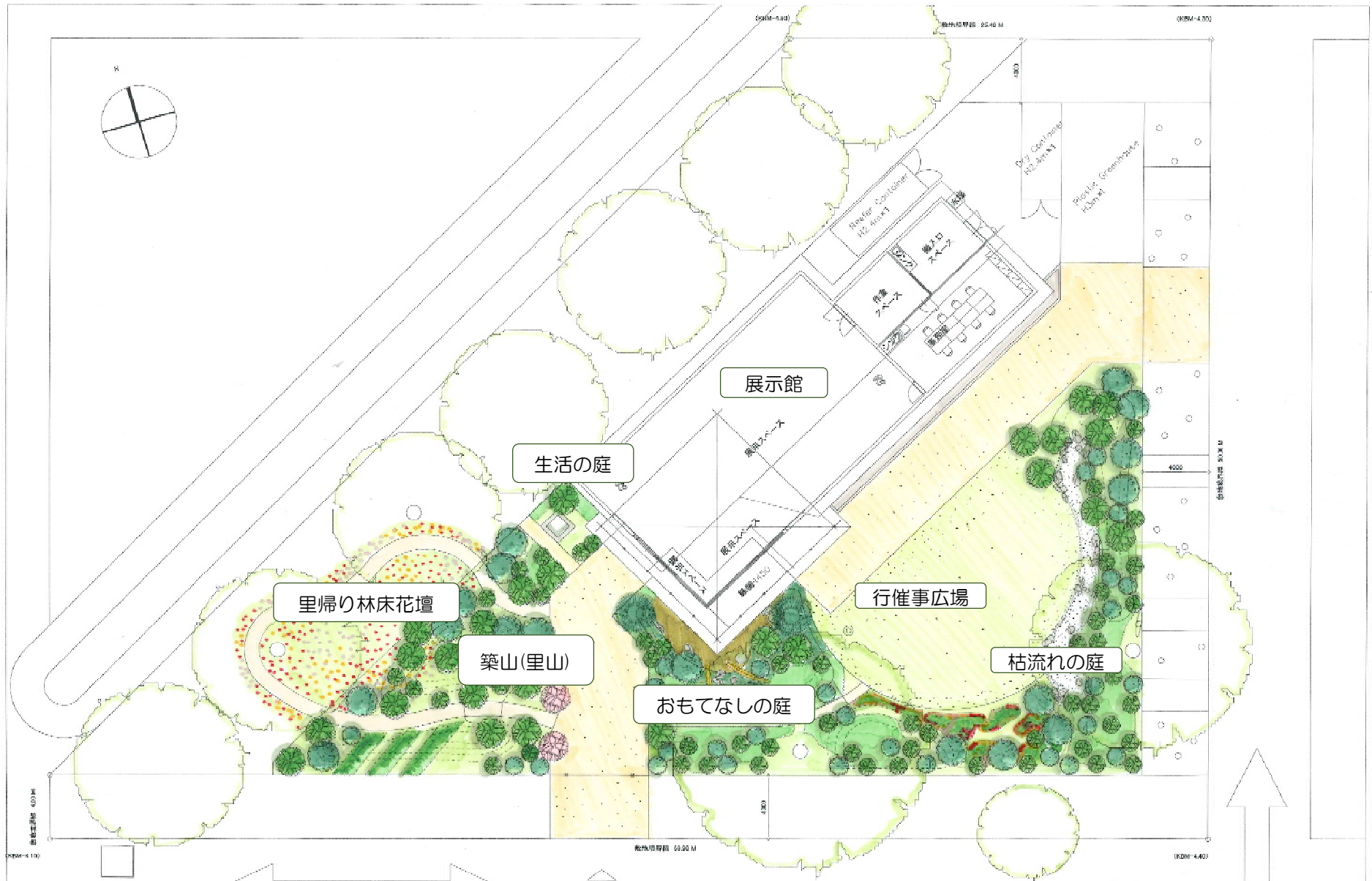
日本国出展計画図