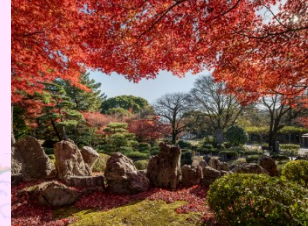
3 名古屋城二之丸庭園