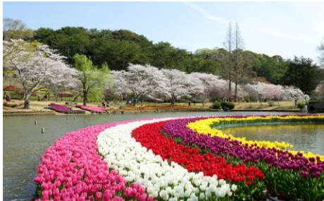
①はままつフラワーパーク（浜松市）