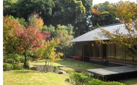
④浜松市茶室 松韻亭（浜松市）