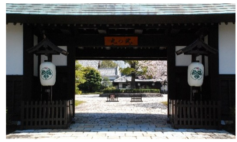
⑦葛城北の丸（袋井市）