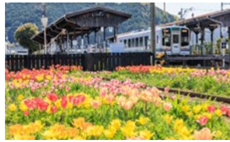
⑤天浜線 花のリレープロジェクト（浜松市）