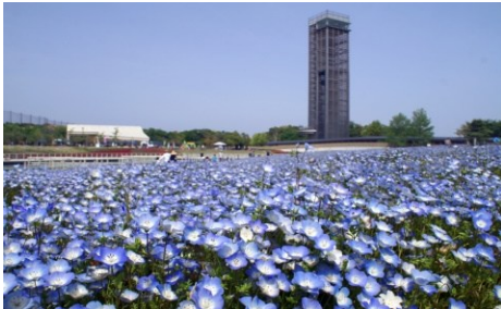
②浜名湖ガーデンパーク（浜松市）