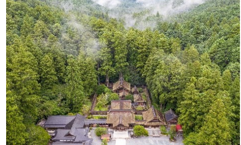
⑥遠江國一宮 小國神社（森町）