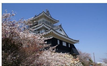
④浜松城公園（浜松市）