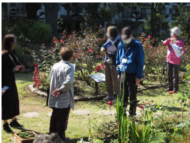
@平塚市／八幡山の洋館のバラ見学