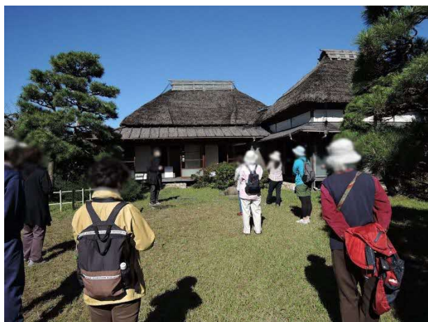
@横須賀市／万代会館の保全作業+邸園解説