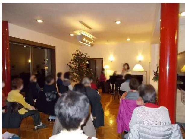
@横浜市戸塚区／俣野別邸でのコンサート