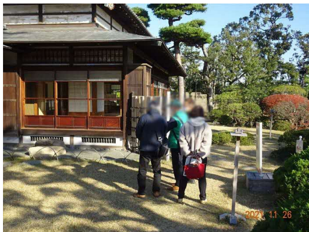
@大磯町／明治記念大磯邸園ガイドツアー