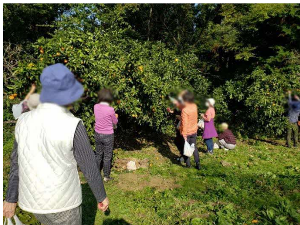
@二宮町／湘南みかんの収穫体験