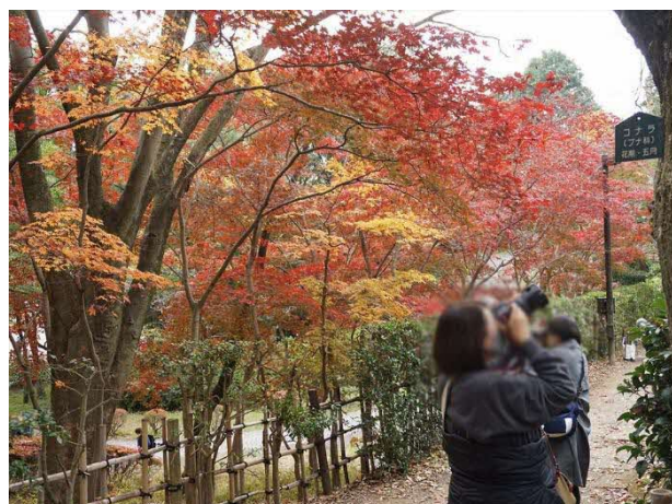
@鎌倉市／湘南の邸園でのカメラ講座