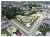
⑧大内氏館跡 池泉庭園