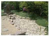
⑦大内氏館跡 枯山水庭園