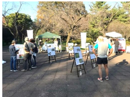
●都立武蔵野公園での会場