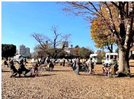
●都立武蔵国分寺公園での会場

コロナ禍における安全で安心なイベントのあり方を模索することを目的として実施場所と実施時期を分散するイベントを実施した。それと同時に、密にならない屋外でのパネル展示を行い、むさしの・ガーデン紀行の取り組みと地域の魅力を様々な角度からの紹介を行った。また、地域のキッチンカー等との連携でカフェ空間を創出した。この取り組みは、事務局、観光協会、構成庭園、キッチンカーや地域店舗との協働で行われ、今後の地域に根差した取り組みの端緒となるものだった。