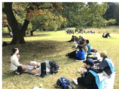
●青空の下で、密にならない空間を保ち、コロナ感染対策しながらランチを楽しむ参加者。

モデルコースをほぼ一日の行程で周遊。移動には、地域で運営されているレンタサイクルを利用したサイクリングツアーを行った。昼食は、野外でのピクニックランチ（地元カフェ調達のお弁当とスイーツ、飲み物）を楽しんだ。