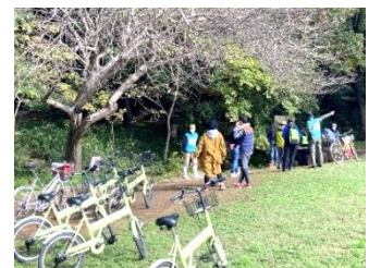
●緑豊かな地域を自転車（レンタサイクル）で回遊。