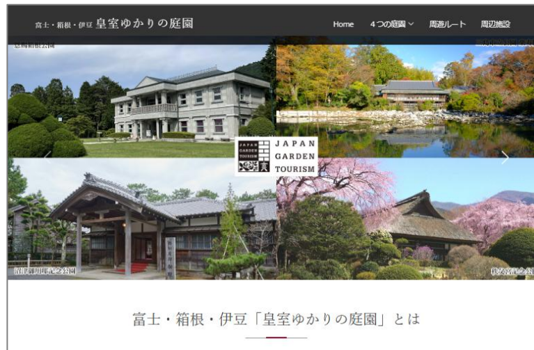
協議会ホームページTOP（イメージ）