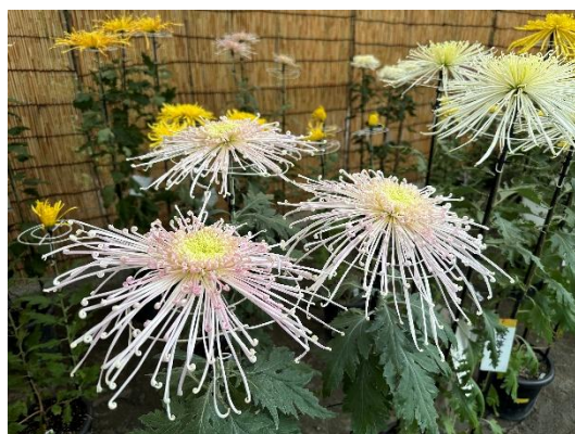
沼津御用邸記念公園