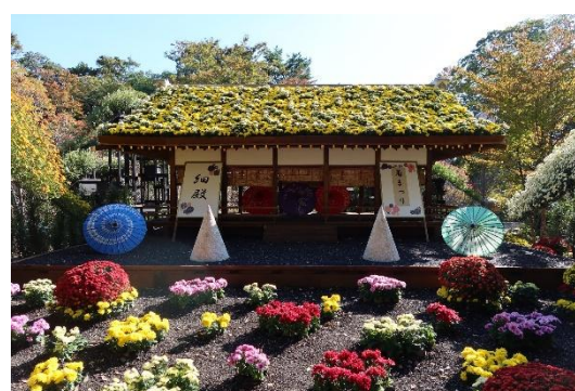
三島市立公園楽寿園