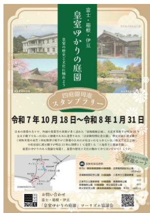
スタンプラリーチラシ

4庭園でスタンプラリーを実施。スタンプを集めた方へ特典としてガーデンリズムオリジナルトートバックを進呈