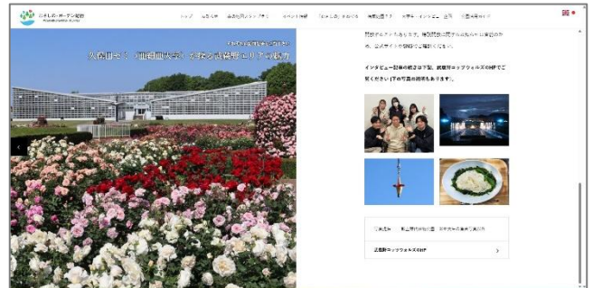
●インタビュー記事をむさしの・ガーデン紀行 HPに掲載