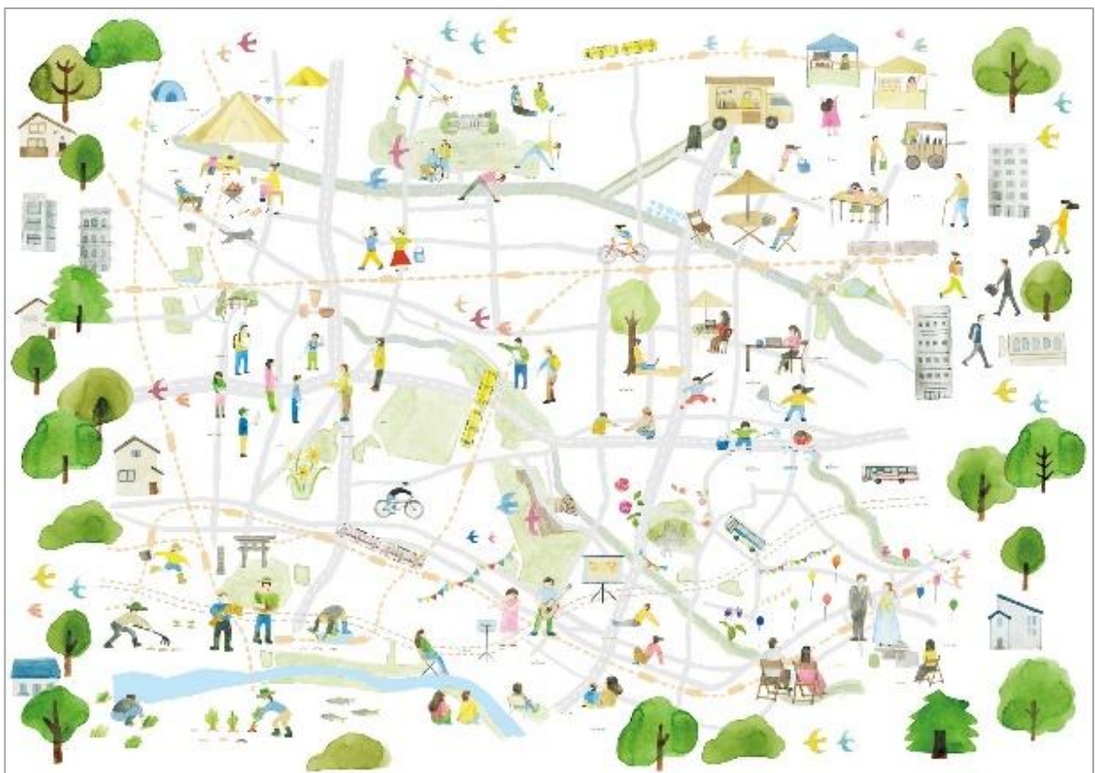
●未来ビジョンのイラスト