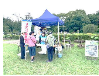
●イベントスタッフで協力

今年度の新しいコラボ企画として、亜大生が構成庭園や観光協会を訪ね、現地のスタッフの話を聞いてまとめるインタビューを行った。今回は亜大生が4班に分かれ、深大寺、野川公園、神代植物公園、武蔵野市観光機構を取材し、インタビュー記事として原稿にまとめた。原稿は、取材先の確認を経て、むさしの・ガーデン紀行のHPに掲載された。この企画は、今後、継続した企画として、構成庭園を順番に取り上げて行く予定である。