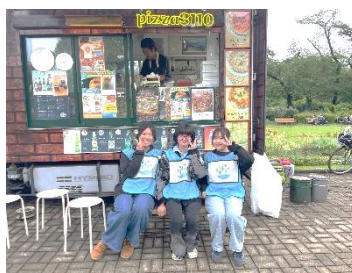
●キッチンカーと大学生スタッフ