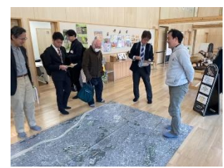
●野川公園・自然観察センターにて