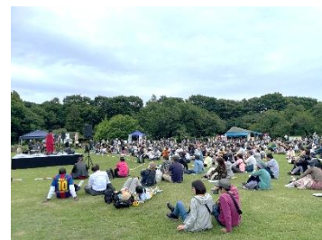
●同日開催のバラコンサート