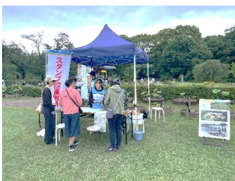
●スペシャルラリーポイント

継続事業として、森の地図スタンプラリーの開催に連動して行っている「オープンカフェ&パネル展示」を行った。感染症(コロナ)対策として実施場所と時期を分散し、密にならない屋外でカフェやパネル展示を行うものとしてスタートした企画。今回は、神代植物公園と武蔵国分寺公園の2箇所で行う予定であったが、天候の関係で、武蔵国分寺公園会場が中止となり、神代植物公園会場で2日間行った。パネル展示は神代植物公園の歴史をテーマとしたもの。神代植物公園では、春のバラフェスタが開催中で、バラコンサートが同日開催で行われた。会場には、期日限定のスペシャルスタンプを設置した。また、バラコンサートには、近隣の構成庭園である深大寺のお坊さんのトーク参加企画もあり、構成庭園間の連携の輪が広がった。