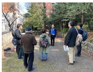
●殿ヶ谷戸庭園にて