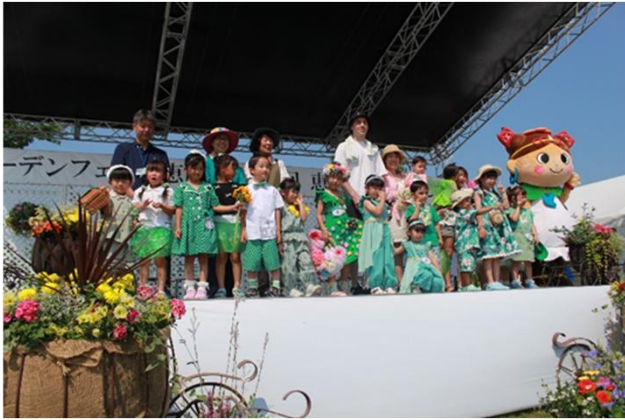
キッズフラワーファッションショー