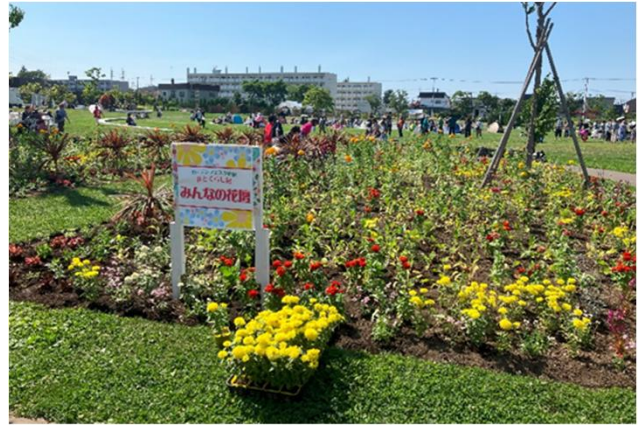
みんなの花壇(当日来場者植え込みし完成)