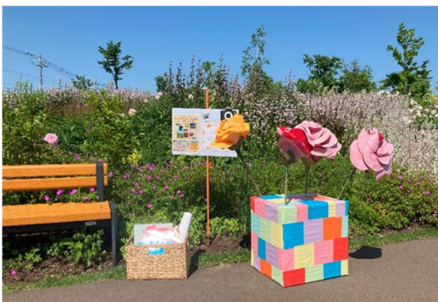
Eえにわサポーターズクラブ