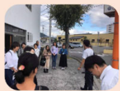
空き家見学まちあるきツアー