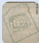
古地図も把握して現在の都市のあり方を検討します

公共経営に関するコンサルタント業務を行います。主に、都市計画関係、観光関係、まちづくり関係を専門分野として、幅広いリサーチとクリエイティブな制作を得意とします。