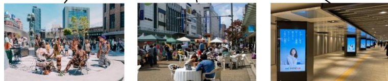
駅前広場の運営 道路空間の活用 広告事業の実施

エリアマネジメント活動について、官民協調で取り組む事項、費用の負担方法、関係者の役割分担等を設定