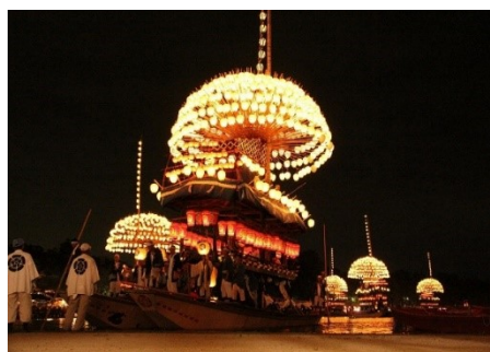
【尾張津島天王祭（宵祭）】

国指定の重要文化財「津島神社本殿・楼門」及びその周辺地域と、600年近く続く尾張津島天のうまつり王祭、津島駅西地区の山車祭や石採祭及び茶の湯文化からなる歴史的風致の維持向上を図るため、津島駅西地区に所在する旧津島信用金庫本店等の歴史的建造物の保存・活用事業や、山車等が巡行する道路の美装化、地域の子供たちへの歴史・文化学習事業等を位置づけています。