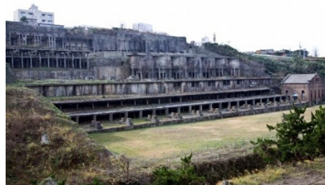
【佐渡金銀山遺跡（北沢浮遊選鉱場）】

国指定の重要文化財「旧佐渡鉱山採鉱施設」、国指定の史跡「佐渡金銀山遺跡」及びその周辺の鉱山町一帯と、善知鳥神社祭礼や鉱山祭とそこで披露される郷土芸能、無名異焼の製造・販売等からなる歴史的風致の維持向上を図るため、歴史的建造物の保存修理、公有化した旧深見家住宅等の歴史的建造物を活用した拠点施設整備、それら歴史的建造物を回遊するための道路の美装化等の事業や、相川音頭を踊るイベントの宵乃舞など、地域行事の運営にかかる支援を位置づけています。