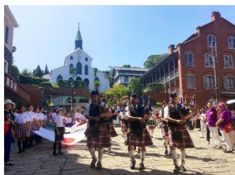
【長崎居留地まつり】

国宝「大浦天主堂」や国指定の重要文化財「旧グラバー住宅」、重要伝統的建造物群保存地区「長崎市東山手・南山手重要伝統的建造物群保存地区」及びその周辺地域と、歴史的建造物等の保存活動の一環として始まった長崎居留地まつりや大浦諏訪神社の大浦くんち等の歴史的風致の維持及び向上を図るため、旧グラバー住宅をはじめとする歴史的建造物の保存修理や、歴史的建造物のライトアップ、市民への歴史学習講座の開催等の事業を位置づけています。