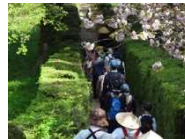
塩田平の札所巡り