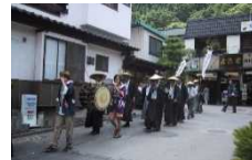
西内地区の祇園祭

地区ごとに有する共同浴場は地域住民が共同で運営している。また、鹿教湯温泉を行列する祇園祭が古くからつづいている。