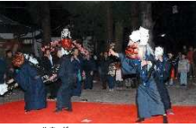
山家神社の大神楽

真田地域の獅子舞(大神楽)は、集落ごとに特徴をもち、住民で協力しながら継承されている。