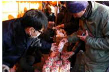
上田市八日堂の蘇民将来符頒布習俗