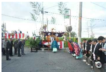
吉田神社の祭礼の様子(船渡神事)