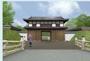
大手門の完成予想図 ▶

市民との協働により、水戸城大手門と二の丸角櫓といった歴史的建造物の復元・整備を行う。