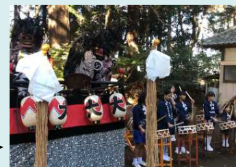
大串のささらばやし ▶

無形民俗文化財等の伝承保存及び後継者育成を図るため、活動団体に対して補助金を交付して、その活動を支援する。