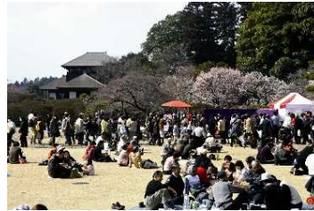
現在の梅まつりの様子

明治以降に観梅の催しが始まり、梅まつりとして本市を代表する伝統行事となった。また、隣接する千波湖は借楽園の借景となり、周辺の緑地とあわせて、今も人々に親しまれている。