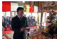
紅樹院で開催される茶祖奉告祭

抹茶生産に特化した覆下栽培にみる茶畑景観とともに、紅樹院の「茶祖奉告祭」、70年以上の歴史のある「学校茶摘み体験」を通して広く市民に親しまれており、歴史的風致のひとつになっている。