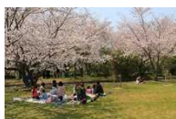
八ツ面山での行楽を楽しむ人々

西尾城下町の夏の風物詩である西尾祇園祭や、八ツ面山に鎮座する久麻久神社への参詣、行楽といった人々の活動により、市街地と久麻久神社を含む八ツ面山は深く結びつき一体となった歴史的風致を形成している。