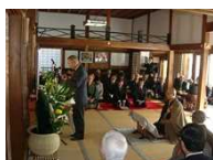
吉良義央公毎歳忌

吉良義央を顕彰する毎歳忌が90年間にわたり毎年開催され、また吉良氏ゆかりの寺院で開催される「西野町のお釈迦さん」「矢田のおかげん」は、地域の伝統行事として定着し、吉良氏ゆかりの建造物と人々の活動が一体となった吉良荘の歴史的風致を形成している。