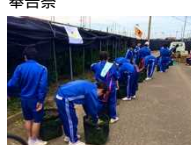
学校茶摘み体験の様子