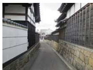
崇覚寺と唯法寺の間の路地

西尾城下町をもとに発展した市街地では、城下町時代の町割りや道路、社寺等の歴史的建造物が多く残されている。