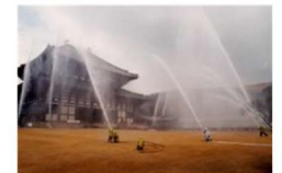
歴史的建造物の防災対策 (奈良県奈良市)