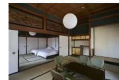
歴史的建造物の保存・再生 (和歌山県広川町)