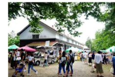
観光交流施設の整備 (山形県新庄市)