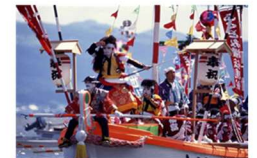
伝統行事等の支援 (島根県松江市)