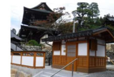
休憩所の整備 (岐阜県高山市)