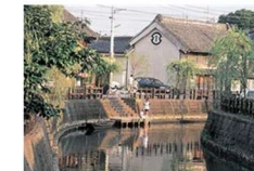
水辺空間の復元整備 (千葉県香取市)