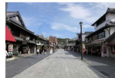
まちなみの高質化 (福岡県太宰府市)