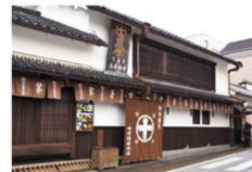
歴史的建造物の修景 (京都府宇治市)